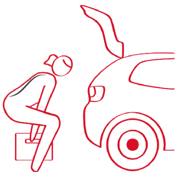
Diep van de grond tillen:

Let er op dat de boodschappen in de auto geplaatst worden met een goede basishouding: