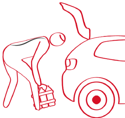
Plaatsen in de koffer: